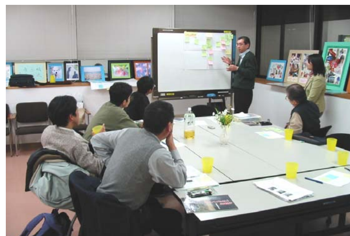
定期の研修会や支援の検討会