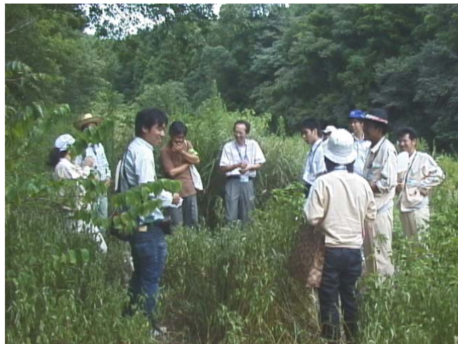
周辺環境調査と改良構想 大塚製薬株式会社 徳島板野工場