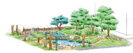
完成予想図 学習会・測量・計画・設計・施工を支援