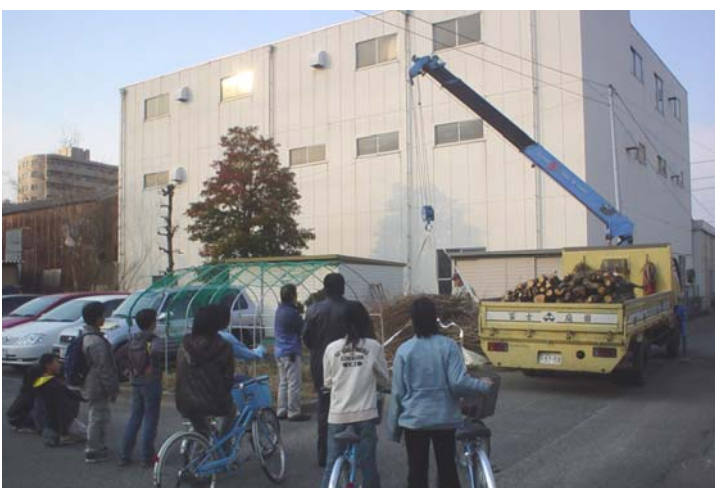
調査・計画・設計・施工・管理・運営