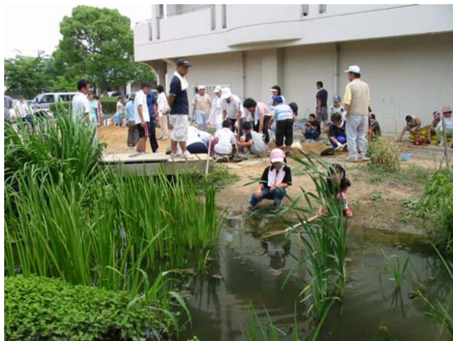
改良計画・設計・施工指導 徳島市加茂名南小学校