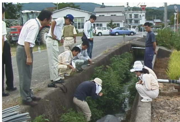
まずは地域の自然を知ることから