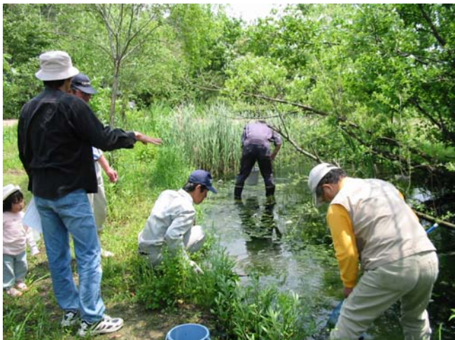
生きもの調査と水質検査 夢とロマンのまちづくり委員会