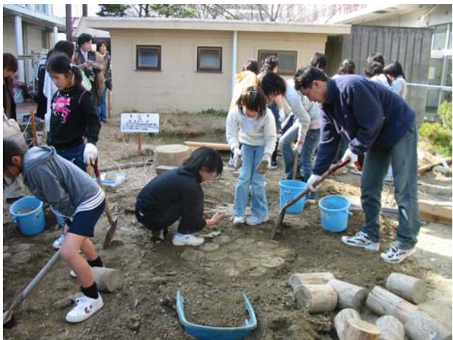
学習会とエコアップ指導 徳島市福島小学校