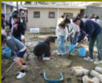
池と草地と林のビオトープ