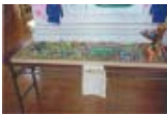
学校ピオトープの模型