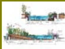
徳島市福島小学校