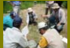
夢とロマンのまちづくり委員会