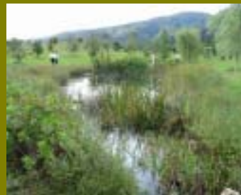
せせらぎ・小川・ため池のビオトープ