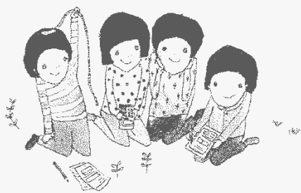
森をしらべてみよう

「森の健康診断」は、最近日本のあちこちで行われている、市民が行う森の調査です。 調査といっても難しいことはなくて、みんなで楽しくにぎやかに、森を調べることができます。 身近にあるスギやヒノキの森を、科学の視点で見つめてみると、新しい発見間違いなし。 あなたもわたしもみんながプチ科学者になって、森について語り合しましょう。 おもしろくて、ちょっとためになる森の健康診断を体験してみて、ついでに大ハマリした人は、森の健康診断の伝道師になってみませんか？ 森に入るのは、楽しいよ～。