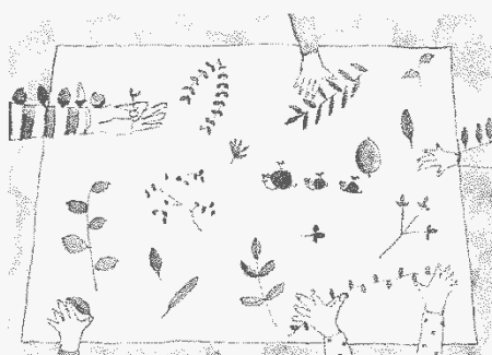
どんな草花があるかな