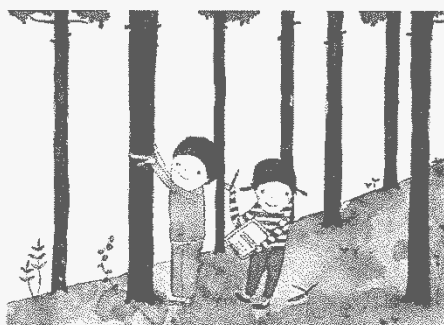
木の太さを測ってみたり