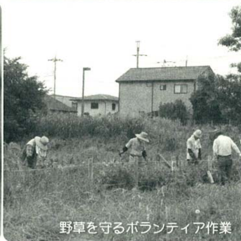
野草を守るボランティア作業