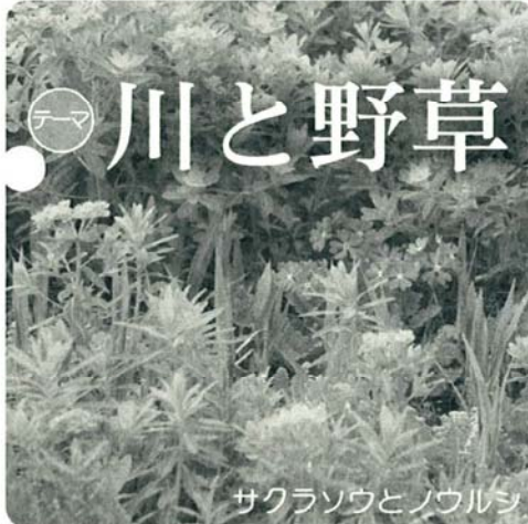
サクラソウとノウルソ

『地域の自然を守り、次世代に伝えたい』 野草は、私たちのくらしに、なくてはならない大切な財産です。そのことを知ってほしい。そして共に守り育てていく力になってほしい。