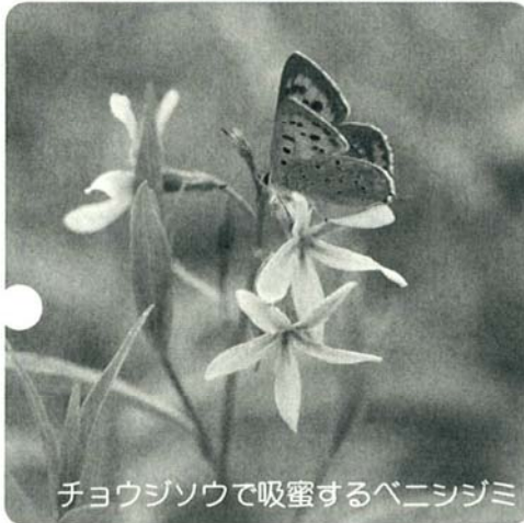
チョウジソウで吸蜜するベニシジミ